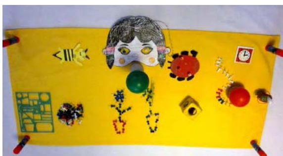
Gruppe A – D „mit einem blauen Auge“

Im Mütterzentrum in Huchting wurde ewig aktuelle Thema Ordnung am 26.April in seinem Für und Wider diskutiert. Die Teilnehmerinnen und Teilnehmer von Happy Hour # No 1 – Ordnung muss sein erarbeiteten an diesem Abend zwei Tischinstallationen, die verschiedene Aspekte des vielschichtigen Themas spannungsgeladen und mit viel Tiefsinn und Humor zum Ausdruck brachten.