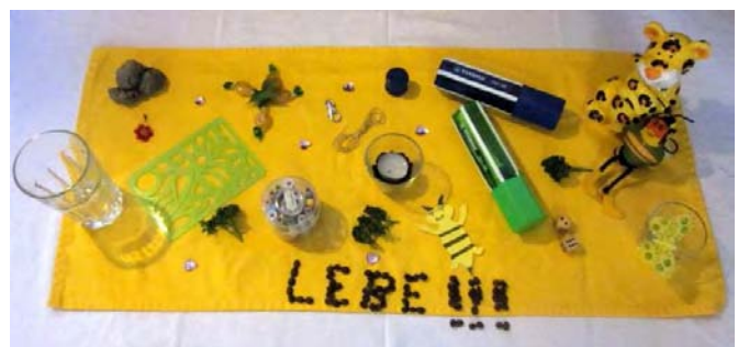
Gruppe H – S „Lebe“